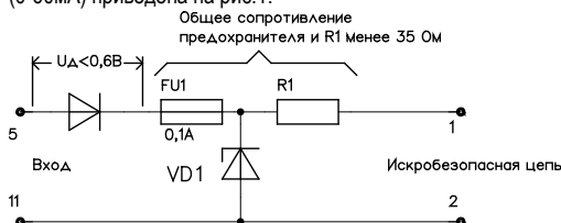
Рис.1. Эквивалентная схема барьера ШСБ(А).

Эквивалентная схема барьера в области рабочих токов (0-60мА) приведена на рис.1.