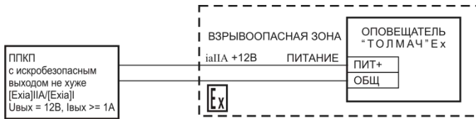
Рис.1 Подключение оповещателя «Толмач» Ех к искробезопасным выходам ППКП.

Взрывобезопасное исполнение оповещателя «Толмач» Ех подключается к искробезопасным электрическим цепям по ГОСТ 30852.10 с искробезопасными параметрами (уровень искробезопасной электрической цепи и подгруппа электрооборудования) соответствующими условиям применения оповещателя «Толмач»Ех во взрывоопасной зоне (рис.1).