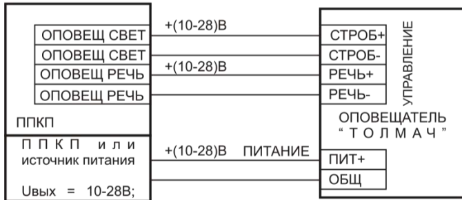
Рис. 2. Типовая схема подключения оповещателя «Толмач»П-Р с запуском по управляющему сигналу